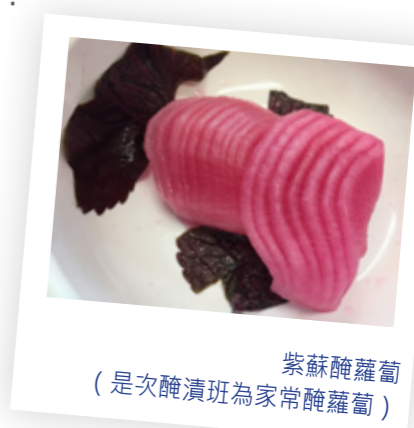
紫蘇醃蘿蔔 (是次醃漬班為家常醃蘿蔔)